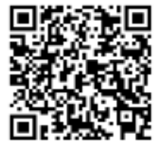
アシスト春日 ホームページ